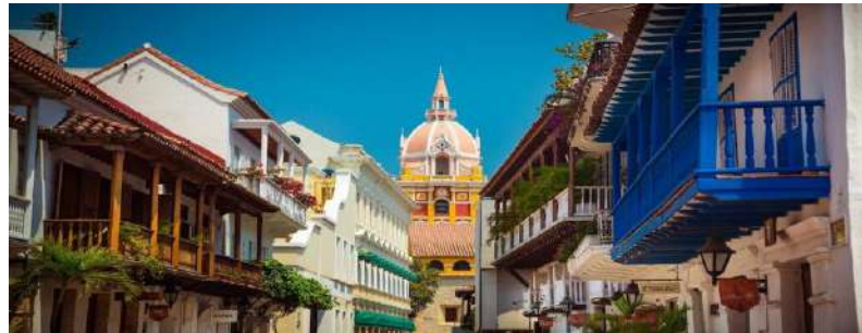
Capítulo Zona Norte

Durante el mes de enero se recibió una solicitud de asesoría presupuestal del capitulo Zona Norte para el evento " Entrenamiento para el Abordaje de Conductas Autolesivas y Riesgo Suicida ".