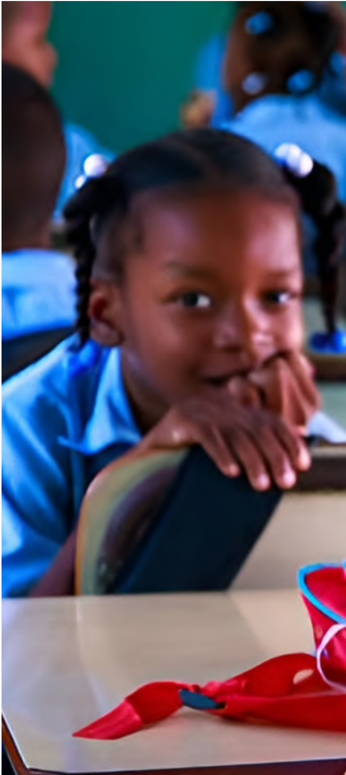
Colegio Colombiano de Psicólogos - Colpsic